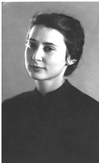
6-й курс Мединститута, Ярославль 1956 г.